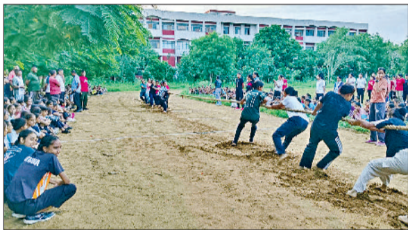
रेवाड़ी। कैप के दौरान रस्साकशी स्पर्धा में दम दिखाते कैडेट्स तथा कैप के दौरान वालीबॉल खेलते कैडेट्स।

ट्रैफिक पुलिस की ओर से बुधवार को स्वामी उमा भारती पब्लिक स्कूल रेवाड़ी व गवर्नमेंट हाई स्कूल कोसली में शिक्षकों व विद्यार्थियों को ट्रैफिक नियमों व नशे के दुष्प्रभावों के बारे में जागरूक किया गया। कार्यक्रम के दौरान ट्रैफिक पुलिस ने विद्यार्थियों व स्कूल स्टाफ को दोपहिया वाहन चलाते समय हेलमेट लगाने, रॉन्ग साइड ड्राइविंग न करने, वाहन चलते समय मोबाइल फोन का इस्तेमाल न करने व नशीले पदार्थों का सेवन न करने की सलाह दी। इसके अलावा नाबालिग बच्चों को टू और फोर व्हीलर गाड़ी न चलाने देने की अपील की। ट्रैफिक पुलिसकी ओर से विद्यार्थियों व शिक्षकों को नशा मुक्ति व खेलों में