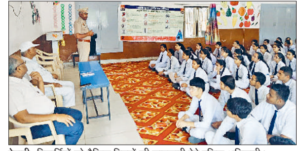
रेवाड़ी। विद्यार्थियों को ट्रैफिक नियमों की जानकारी देते पुलिस अधिकारी।

नौकरी नहीं दी गई, तो कानूनी कार्रवाई करेंगे। बाद में पुलिस ने शव का पोस्टमार्टम करा दिया। पुलिस ने करंट प्रवाहित होने के कारणों की जांच शुरू कर दी। दूसरी ओर युवक की मौत के बाद बड़ी संख्या में ग्रामीण महिलाओं सहित कंपनी पहुंच गए। वहां उचित मुआवजे की मांग व आश्रित को नौकरी की मांग पर ग्रामीण धरने पर बैठ गए। सुरक्षा की दृष्टि से कंपनी परिसर के बाहर भारी पुलिस बल तैनात किया गया। परिवार में अकेला कमाने वाला था