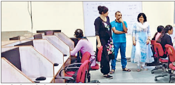
रेवाड़ी। बीफामेसी की प्रवेश परीक्षा देते विद्यार्थी।