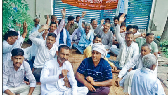
रेवाड़ी। कोसली में हड़ताल पर बैठक पब्लिक हेल्थ के कर्मचारी व कोसली में बंद पड़ा पीएनबी बैंक व बस स्टैंड पर सुचारू रही रोडवेज सेवा।