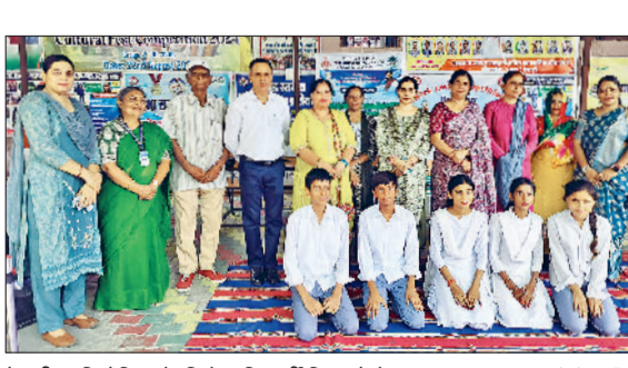
रेवाड़ी। प्रतियोगिता के विजेता विद्यार्थी शिक्षकों के साथ।