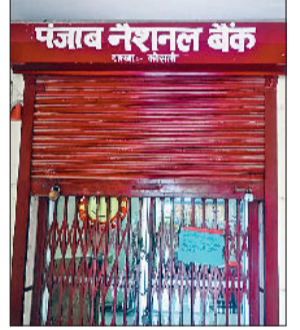
कोसली में भी रहा मिला जुला असर।